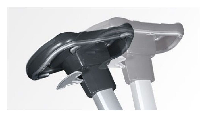
Visina i nagib volana su podesivi kako bi se prilagodili operateru i smanjiti zamor u leđima.