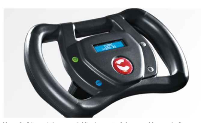
Upravljač je prekriven protivkliznim materijalom, mekim na dodir, za sigurno i udobno korišćenje. Kontrole na upravljaču su jednostavne, intuitivne i lake za korišćenje čak i za neiskusnog operatera, obezbeđujući potpunu kontrolu nad mašinom i proces čišćenja. Podešavanje čišćenja je već konfigurisano kada koristite funkciju automatskog čišćenja. Jednostavno pritisnite dugme AUTO da biste započeli čišćenje.

Kada nije u upotrebi, kompaktne dimenzije mašine omogućavaju da se skladišti bilo gde, čak i u najmanjoj ostavi.